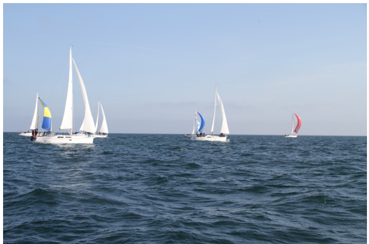
Auf dem Weg Richtung Gedser

Im eigentlich für so viele Boote zu kleinen Hafen von Stubbekøbing, wird es natür-