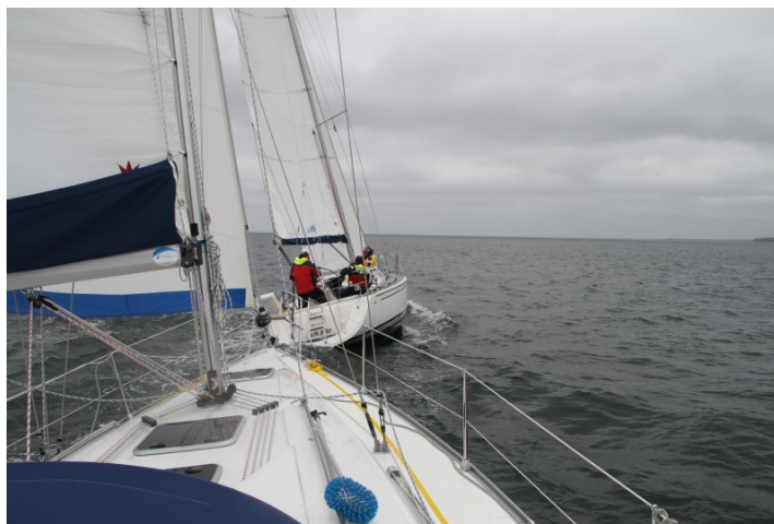
Hoch am Wind