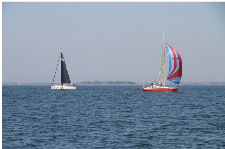
Schönwettersegeln im Fehmarnsund

Wegen der geänderten Streckenführung entschließen wir uns, am Freitag in aller Ruhe das Boot nach Heiligenhafen zu überführen und noch etwas zu Segeln. Es ist nicht wirklich viel Wind (nach wie vor aus nord-westlicher Richtung) aber es ist sehr schön unter blauem Himmel, die gelben Rapsfelder an den Ufern und die vielen weißen und bunten Segel auf dem Fehmarnsund zu sehen. Wir tanken, geben die Yacht noch am Freitag ohne Kratzer oder andere Beschädigungen ab und fahren noch in der Nacht nach Hause.