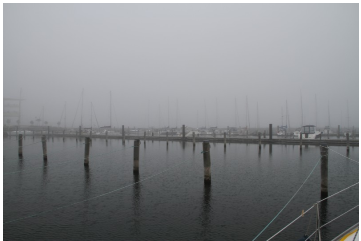
Morgennebel in Warnemünde verzögert den Regattastart

Donnerstag früh: Der Blick nach draußen ist etwas trübe. Aber es ist nicht der Alkohol, sondern tatsächlich der Morgennebel, der die Sicht vertrübt. Die Regattaleitung entscheidet sich für eine Startverschiebung, Funkbereitschaft auf Kanal 68 soll gehalten werden. Nach einiger Zeit lichtet sich der Nebel, die Boote werden gebeten, sich gegen 10 Uhr in Startbereitschaft zu begeben. Die Boote von der hohen Düne, die das Fahrwasser queren müssen, sollen dabei die einlaufende Fähre um 10:23 Uhr berücksichtigen. Ist aber schon kein Thema mehr, da der Nebel aufklart und die Sicht wieder (geschätzt) größer 3 km ist. Wir setzen trotzdem sicherheitshalber die Positionslichter. Unsere Startzeit ist um 11:10 Uhr, bei schwachen Winden aus NW. Das Regattafeld bewegt sich entsprechend langsam und wir werden einen langen Tag auf der Kreuz haben. Unsere Bavaria kann nicht hoch an den Wind gehen und die Wetterverhältnisse sind wohl unter Land auch günstiger, so verlieren wir kontinuierlich gegenüber unseren Mitstreitern. Der Wind wird über den Tag bei schwachen 2-3 bft aus nordwestlicher Richtung