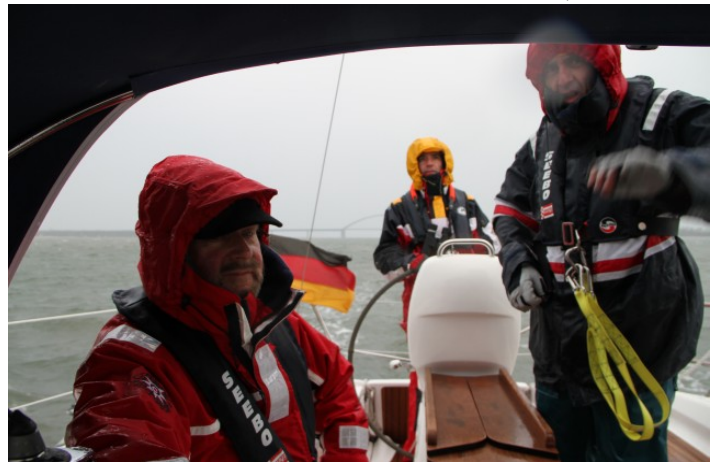
Schmuddelwetter auf der Ostsee

Abend nach Burgtiefe überzusetzen, um am nächsten Tag keinen Stress beim Start zu haben. Bei Regen, Wind und Welle fahren wir allerdings nur unter Motor; uns ist einfach nicht danach, auf der kurzen Strecke die Segel auszupacken. Gegen 20:00 Uhr kommen wir in Burgtiefe an und wir verspüren erstmal den Wunsch, etwas zu essen und uns wieder aufzuwärmen. So ziehen wir, ohne uns groß umzuziehen, im Ölzeug los und finden im „Haus am Strand“ noch Platz an einem Tisch. Unsere beiden Tischnachbarn fahren, wie viele andere Gäste,