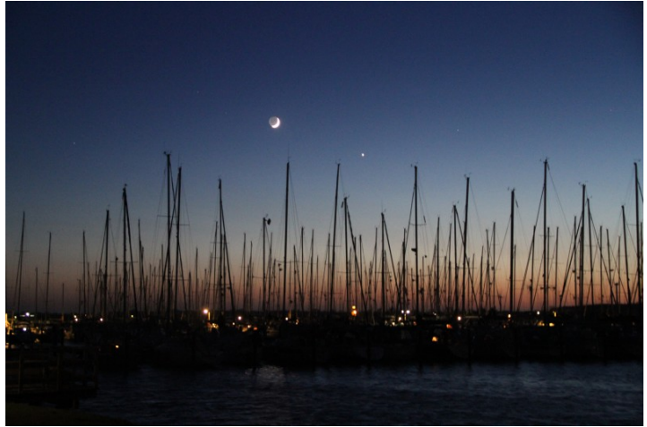
Hafen von Burgtiefe am Sonntagabend, keine Spur mehr von schlechtem Wetter

Die Heizung lief wohl nicht die ganze Nacht. Es ist wieder kalt geworden und im Inneren hat sich Kondenswasser gebildet, das teilweise schon von der Decke tropft. Wir stehen gegen 7h auf. Der Wind hat nicht ab-, sondern weiter zugenommen. Die Regattaleitung sieht sich gezwungen, die Wettfahrt wegen des starken Windes (die Böen erreichen wohl teilweise 8 bft) ganz abzusagen. Die Entscheidung, schon am Vorabend einzutreffen, war also gar nicht so schlecht, sonst hätten wir immer noch in Heiligenhafen festgehalten. Bei der Skipperbesprechung (alle stehen in Ölzeug um den Regattabus) erfahren wir, dass es am nächsten Tag direkt nach Stubbekøbing geht und wir einfach an Gedser vorbeifahren. Der Tag gehört also vielmehr den Kite-Surfern, die Sprünge bis zu einigen Metern Höhe ausführen. Im Laufe des Tages lässt der Wind allerdings auch nach und es kommt sogar etwas Sonne heraus, die zu einem Spaziergang am Südstrand einlädt. Zum Abendessen gehen wir erneut ins Haus am Strand, weil es uns gut gefallen und geschmeckt hat.