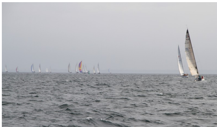
Ansteuerung auf Warnemünde