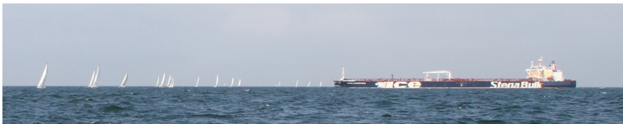
2 Gruppen mit je 7 kurzen Tönen: Ein Tanker trifft auf das Regattafeld und versucht beim Verlassen des VTG, auf sich aufmerksam zu machen;-)

Wir lassen uns von den knapp 80 auf dem gleichen Kurs segelnden Yachten beeindruckt. Noch beeindruckender ist es, wie intim man plötzlich mit der Berufsschiffahrt werden kann. Am Ende erreichen wir um 16:43 Uhr als 45.ter das Ziel und kämpfen uns damit sogar auf Platz 59 in der Gesamtliste vor.