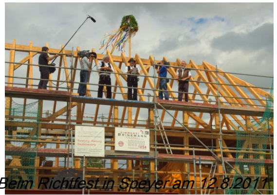
Beim Richtfest in Speyer am 12.8.2011